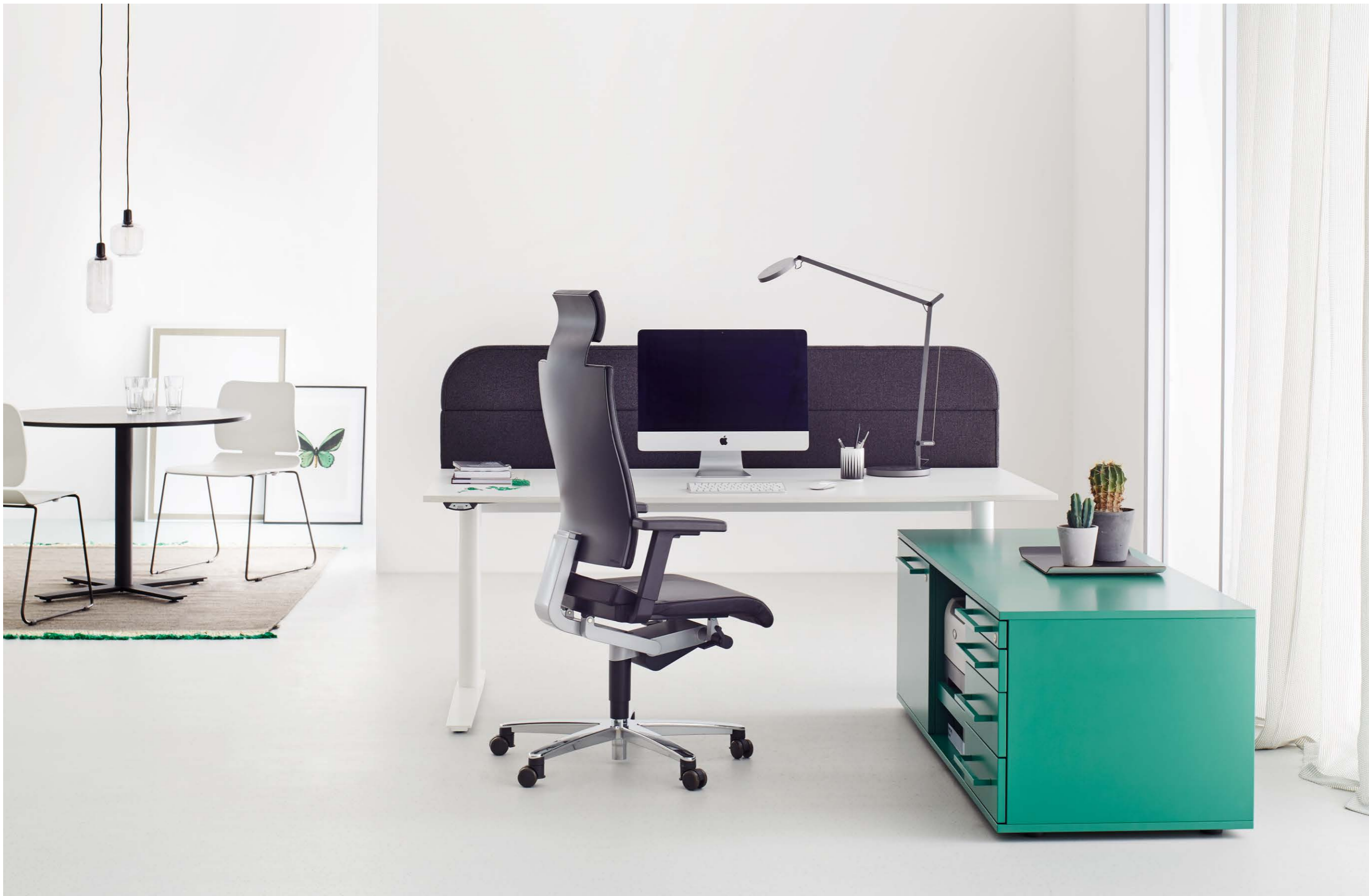
Table assis-debout électrique série CN avec meuble bas technique, paravento M paroi sur table, table de réunion série CN