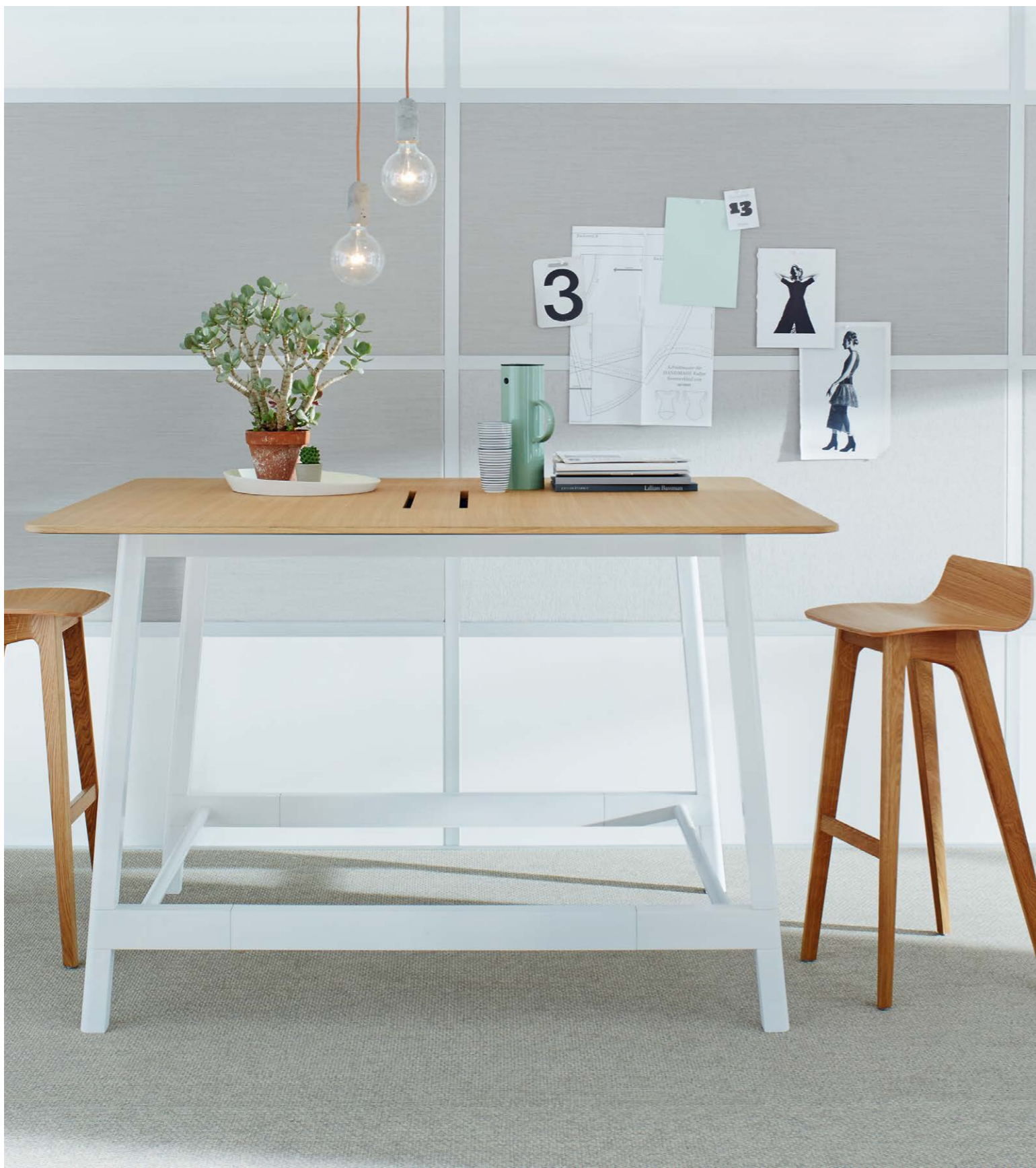
ophelis docks Bench debout avec Userbase