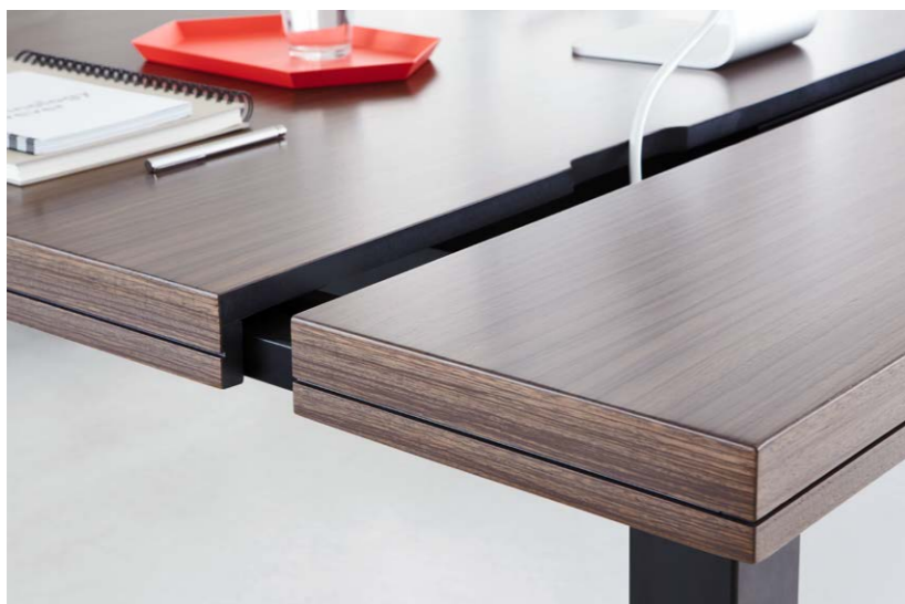
plateau avant coulissant avec sortie de câbles à l'arrière