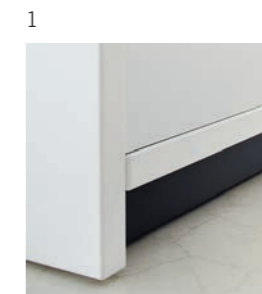
1 et 2 : socle 3 et 4 : tiroirs design

Les possibilités d'agencement sont multiples avec les tiroirs design avec ouverture push-to-open et les revêtements laqués individualisables. Disposé au milieu de l'espace, le socle de glider sera dissimulé par un bandeau de couleur adaptée afin de souligner les finitions planes de l'armoire jusque dans les moindres détails.