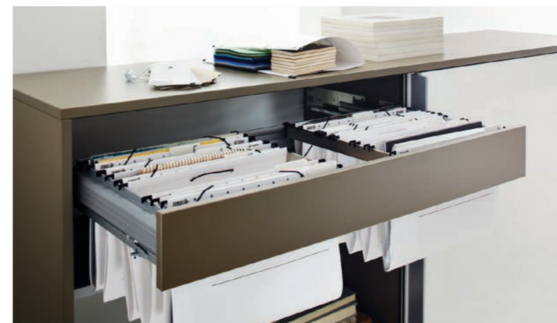
1 : Tiroir pour dossiers suspendus 2 et 3 : paroi acoustique microperforée