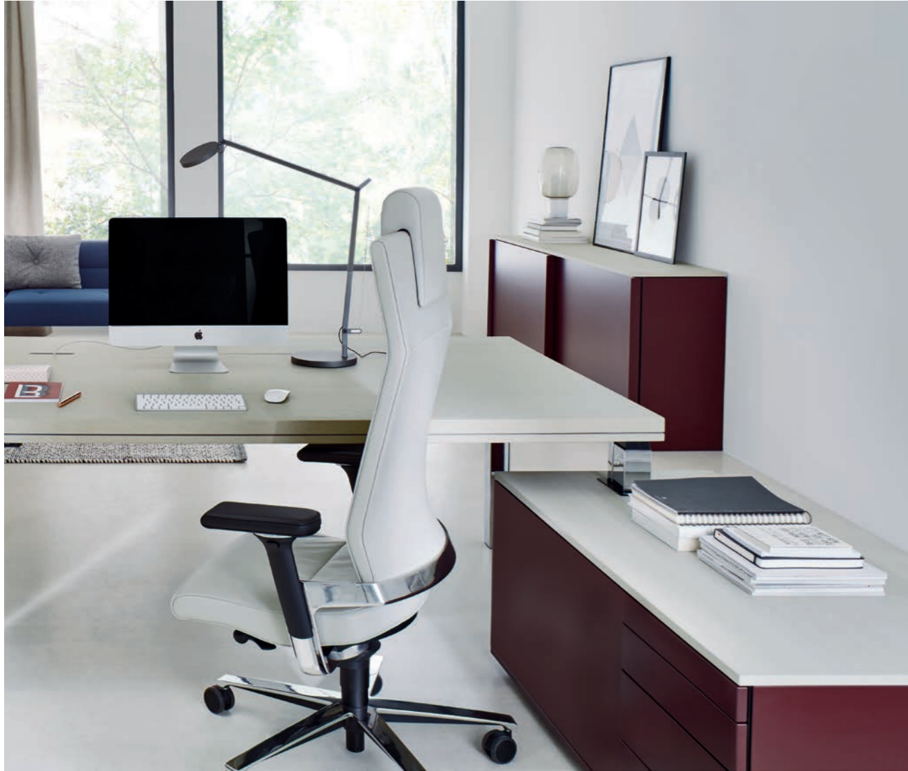
Poste de travail de direction assis/debout électrique radoppio, avec meuble bas technique intégré