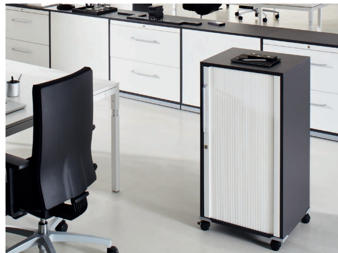
Caisson personnel pick-up, armoire verticale ligne S, système de table série Q3

Dans le cadre de projet où les intervenants ne sont pas toujours les mêmes et où l'interdisciplinarité joue un rôle important, on attend des membres de l'équipe une grande mobilité. Le caisson personnel pick-up est une réalisation compacte du bureau mobile via lequel ophelis propose une alternative au caisson à roulettes. Il sert d'espace de rangement mais également de dépôt des effets personnels puisqu'on peut le fermer à clé. Il est idéal dans le cadre de projet ou dans les espaces de bureau où les postes ne sont pas nominatifs. La poignée du caisson personnel pick-up permet de le déplacer facilement là où vous en avez besoin. Les possibilités de configurations (intérieures et externes) sont multiples pour qu'il s'adapte à toutes les fins : du bureau mobile à l'espace de catering.