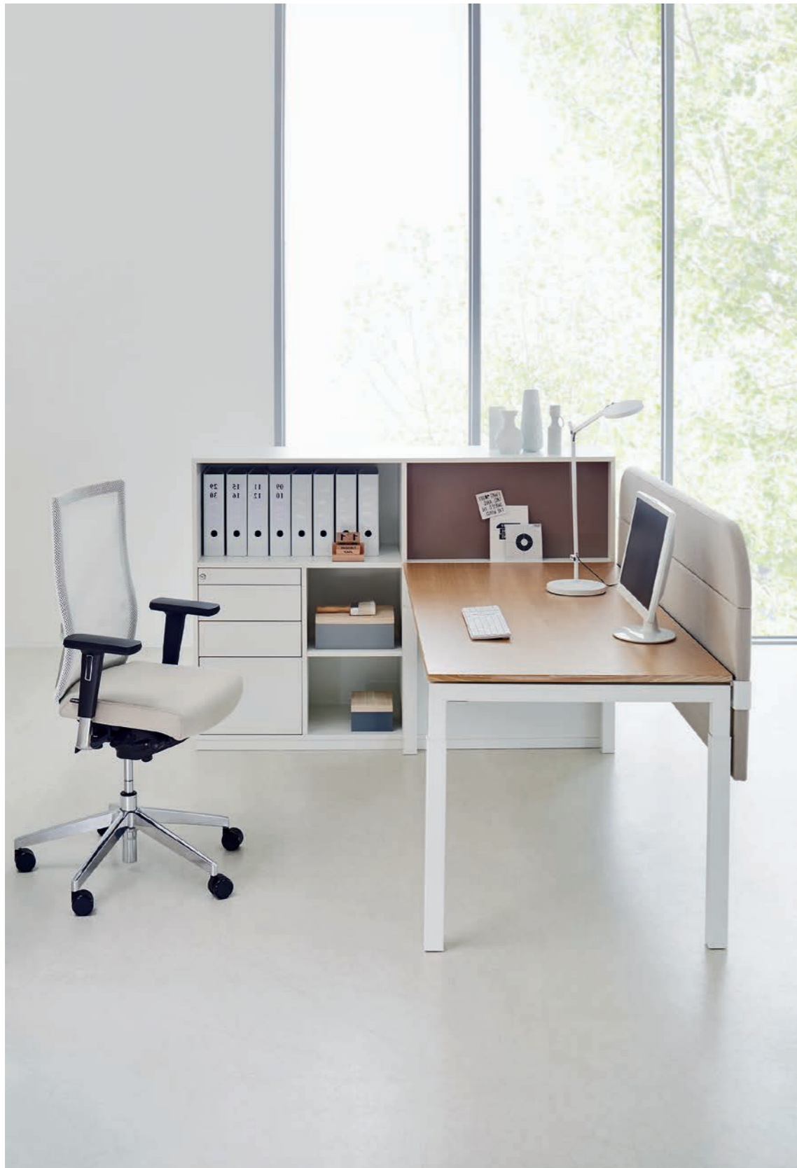
orga.regal ligne S, table de travail série U4, paravento M paroi arrière